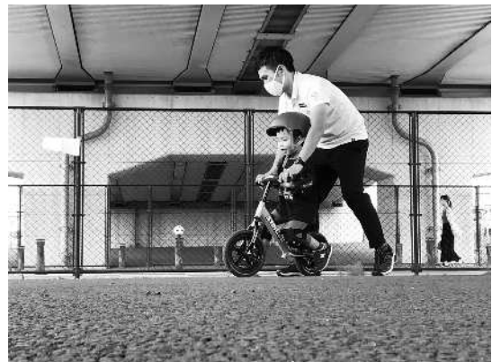
<レンタルパーク事業（イメージ）>