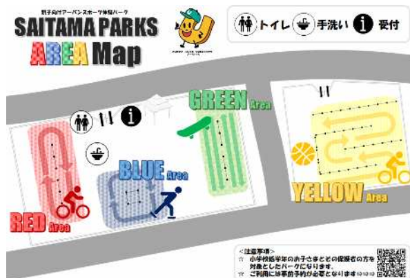
<レンタルパーク事業マップ（予定）>

【種目】 <DAY1> 10月18日（日） フリースタイルバスケットボール、インラインスケート <DAY2> 11月7日（土） フリースタイルフットボール、スケートボード <DAY3> 12月20日（日） フリースタイルバスケットボール、フリースタイルフットボール 3×3、キックバイク／BMXなど（調整中）